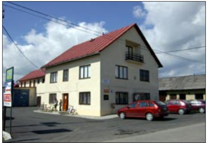
Pošta – vynovená a vyasfaltované je aj okolie