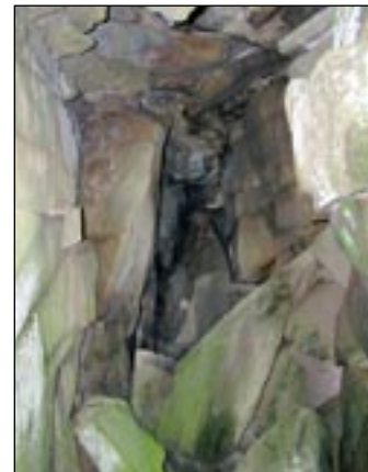
E–FOTO: archív CHKO Námestovo

Nedá mi: „Nebolo by vhodné cestou projektou požiadať z prostried-