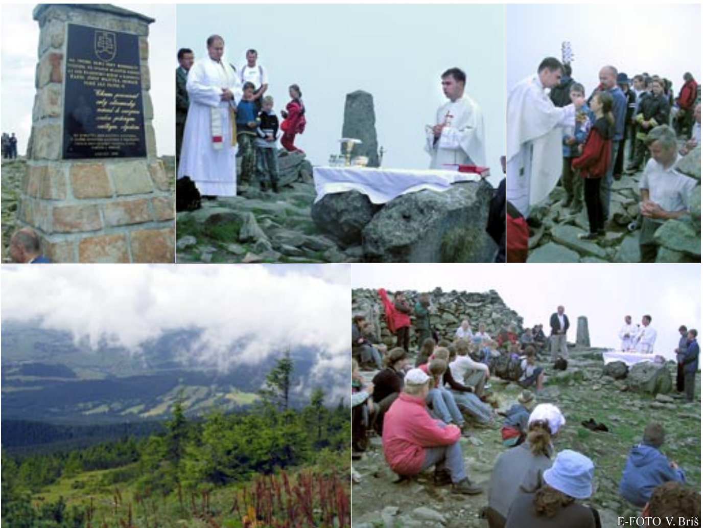
E-FOTO V. Briš

Odpovedzte bez dlhého rozmýšľania na otázku – ktoré 3 veci by ste si zobrali so sebou na pustý ostrov?