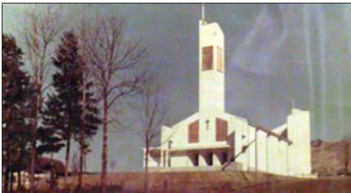
Dokončený nový farský kostol Božského Srdca Ježišovho